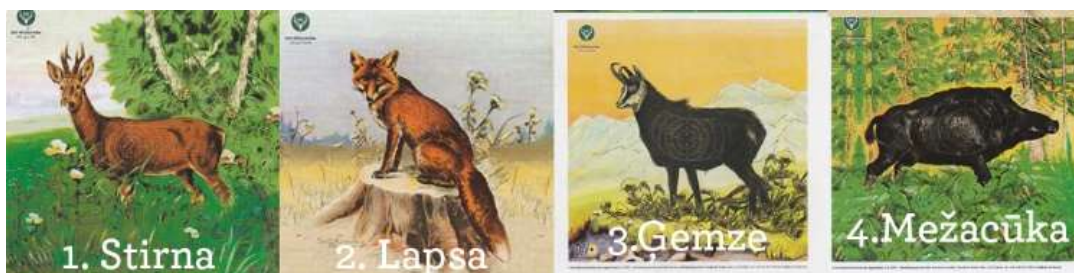
Ilustrācija 2 - mērķi un to šaušanas secība